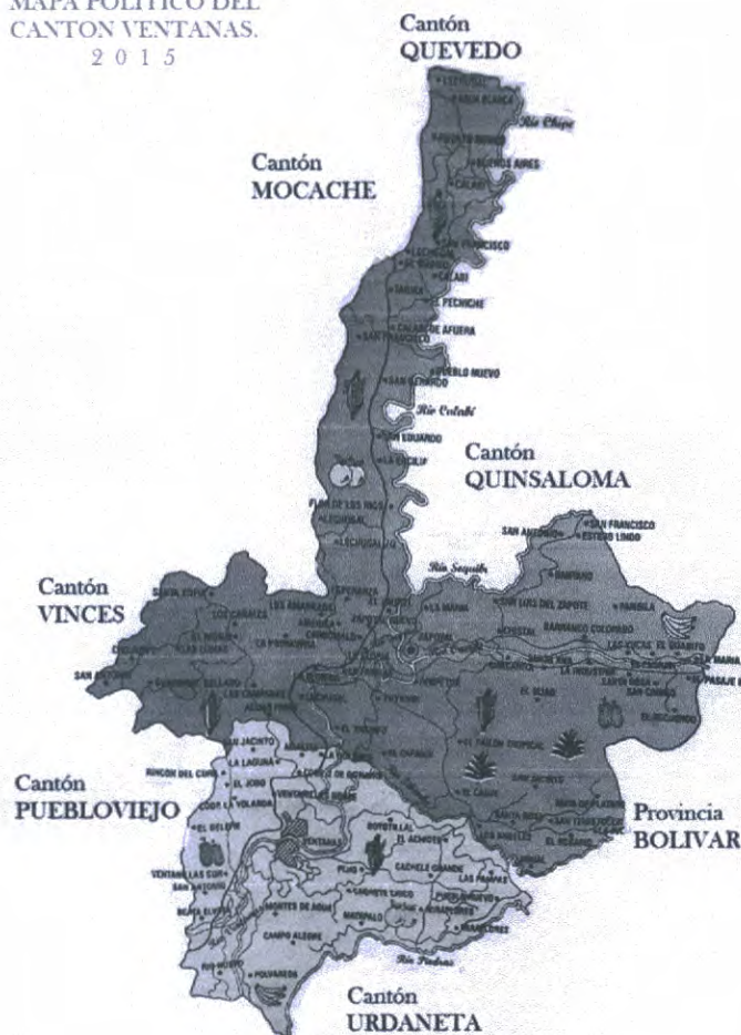
MAPA POLÍTICO DEL CANTÓN VENTANAS. 2015

Candidatos/as: Vocales Junta Parroquial..... CANTÓN VENTANAS