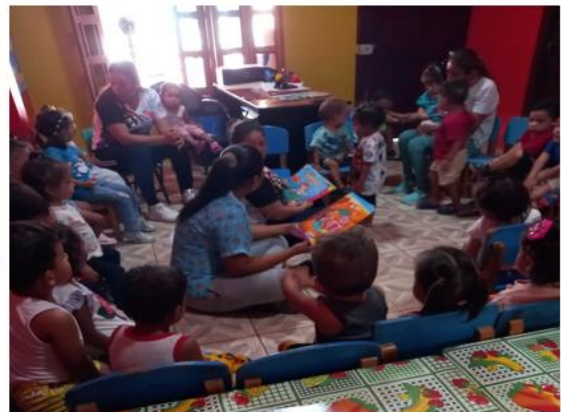
PROYECTO DESARROLLO INFANTIL - CDI