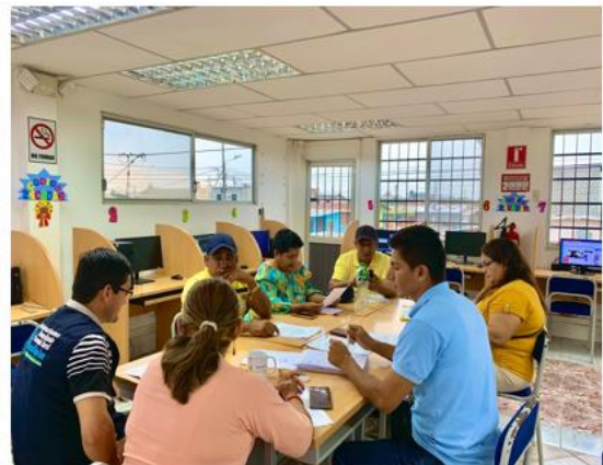
Rendición de cuentas institucional - 2023