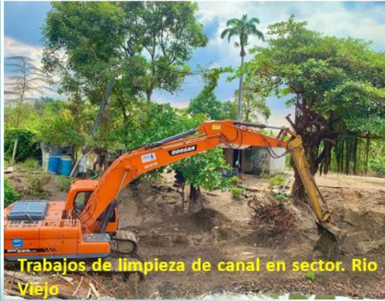
Trabajos de limpieza de canal en sector. Rio Viejo

Gestiones de limpieza de canales ante la Prefectura del Guayas.