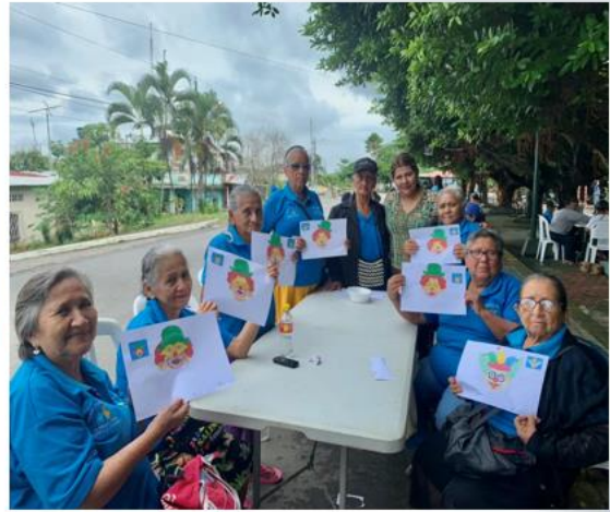
PROYECTO DE ADULTOS MAYORES