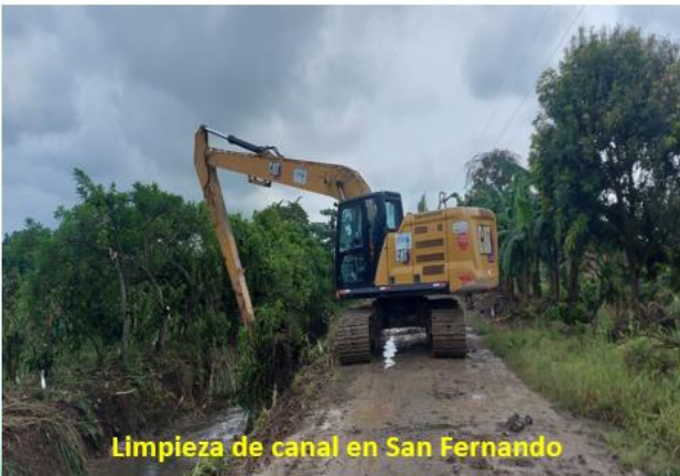
Limpieza de canal en San Fernando

Gestiones de limpieza de canales ante la Prefectura del Guayas.