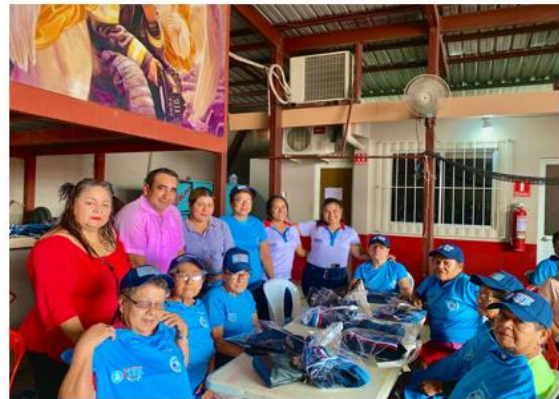
PROYECTO DE ADULTOS MAYORES