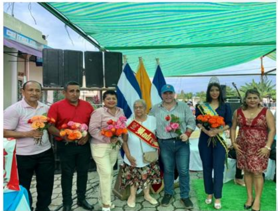
PROYECTO DE ADULTOS MAYORES