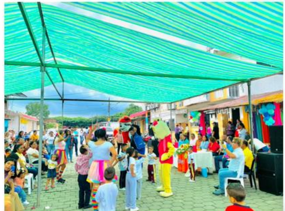
PROYECTO DESARROLLO INFANTIL - CDI