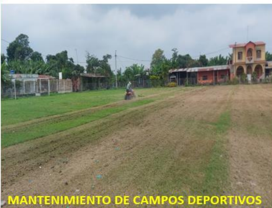
MANTENIMIENTO DE CAMPOS DEPORTIVOS

8.- LAS DEMÁS QUE SEAN DE TRASCENDENCIA PARA EL INTERÉS COLECTIVO.