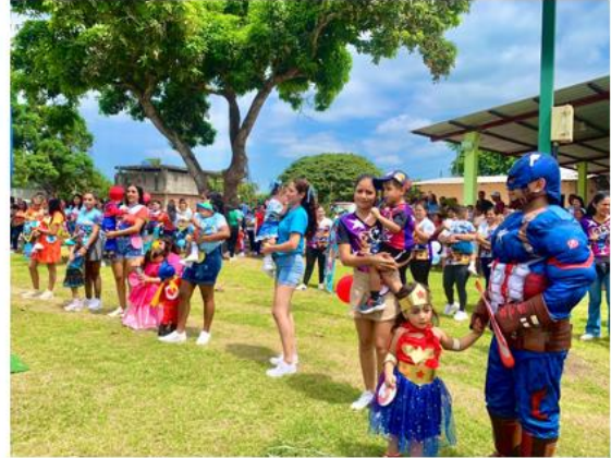
PROYECTO DESARROLLO INFANTIL - CDI