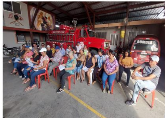
Rendición de cuentas institucional - 2023