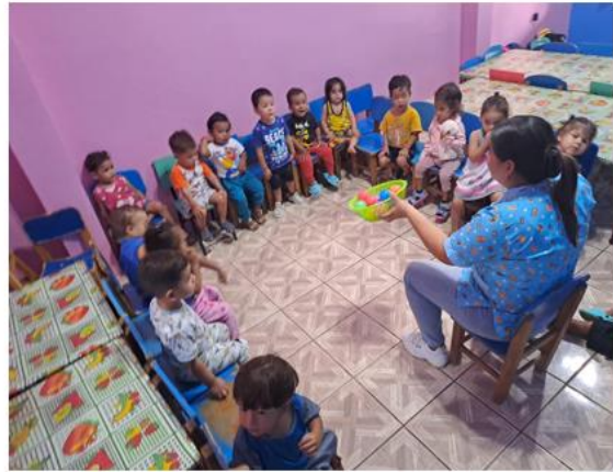
PROYECTO DESARROLLO INFANTIL - CDI