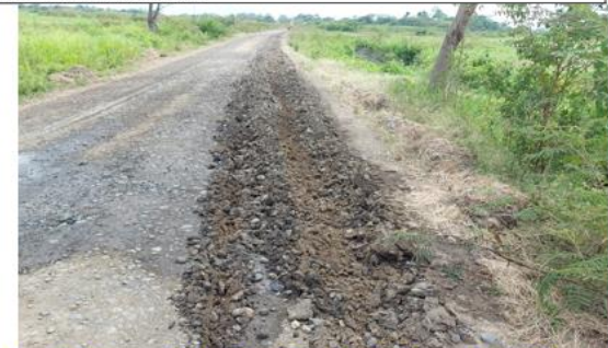
Mejoramiento de camino de la vía Santa Rosa No.1 a Santa Rosa No.2

Rendición de cuentas institucional - 2023