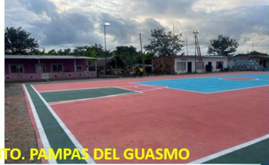
CANCHA DEPORTIVA EN RECINTO. PAMPAS DEL GUASMO

Rendición de cuentas institucional - 2023