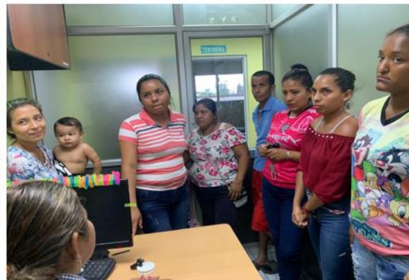
Rendición de cuentas institucional - 2023