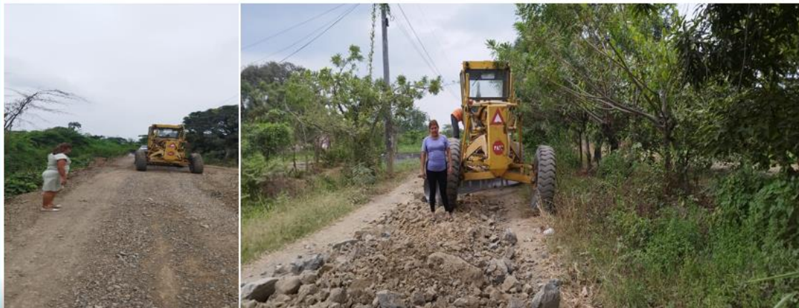
Rendición de cuentas institucional - 2023

Inspecciones de trabajo de mantenimiento vial.