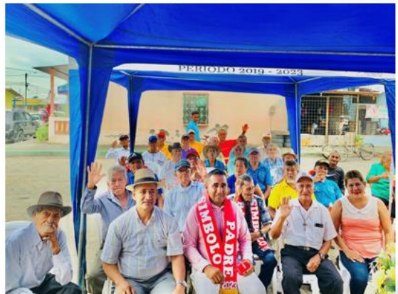
PROYECTO DE ADULTOS MAYORES