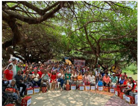
PROYECTO DE ADULTOS MAYORES