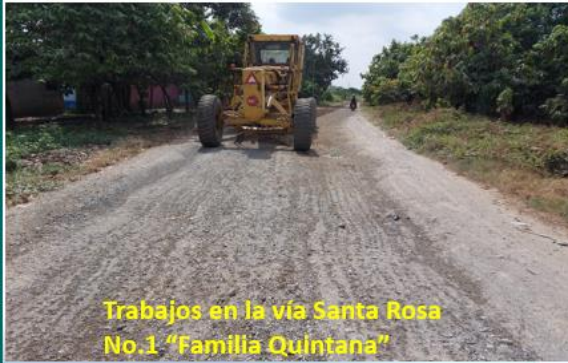
Trabajos en la vía Santa Rosa No.1 "Familia Quintana"

ADQUISICIÓN DE 480M3 DE MATERIAL PÉTREO INCLUYE TRANSPORTE Y TENDIDO DEL MATERIAL PARA BACHEO DE CAMINOS VECINALES DE LOS RECINTOS DE LA PARROQUIA.