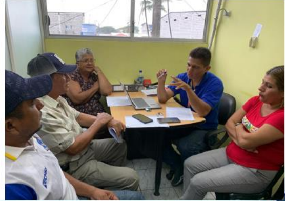
Rendición de cuentas institucional - 2023