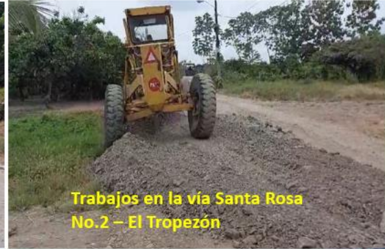
Trabajos en la vía Santa Rosa No.2 – El Tropezón

Rendición de cuentas institucional - 2023