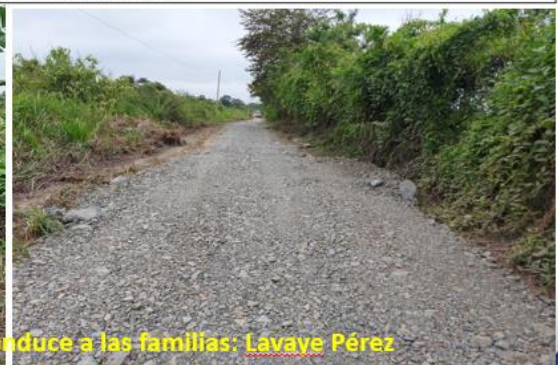
Trabajos en la vía que conduce a las familias: Lavaye Pérez

Rendición de cuentas institucional - 2023