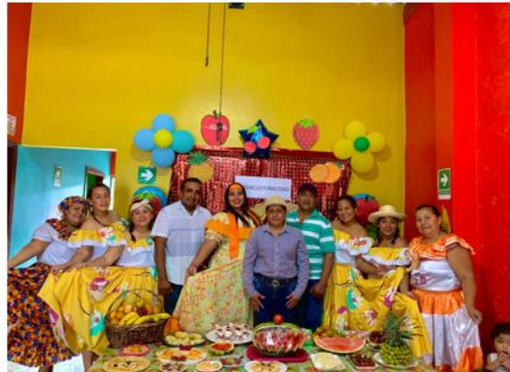
PROYECTO DESARROLLO INFANTIL - CDI