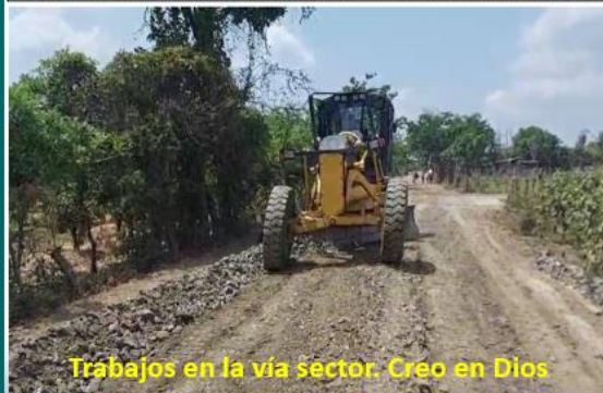
Trabajos en la vía sector: Creo en Dios

ADQUISICIÓN DE 480M3 DE MATERIAL PÉTREO INCLUYE TRANSPORTE Y TENDIDO DEL MATERIAL PARA BACHEO DE CAMINOS VECINALES DE LOS RECINTOS DE LA PARROQUIA.