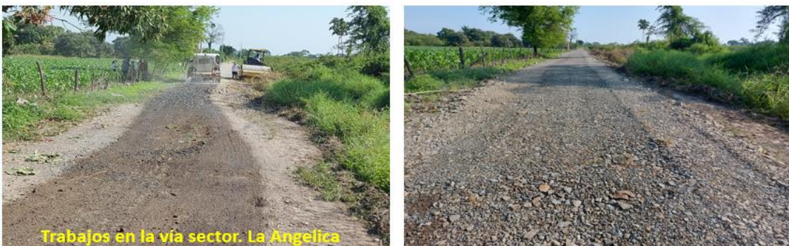
Trabajos en la vía sector. La Angelica

Gestiones de mantenimiento vial ante la Prefectura del Guayas y Municipio de Yaguachi.