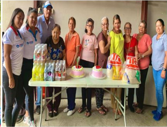
PROYECTO DE ADULTOS MAYORES