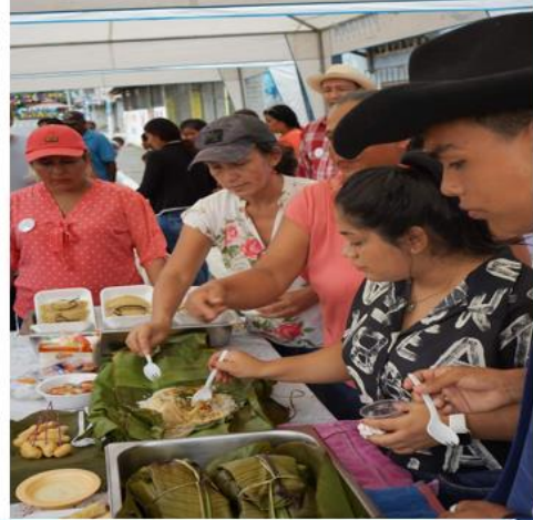
Rendición de cuentas institucional - 2023