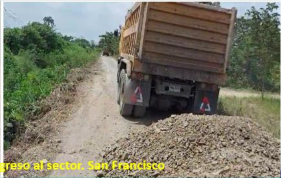
Trabajos en la vía de ingreso al sector. San Francisco

Rendición de cuentas institucional - 2023