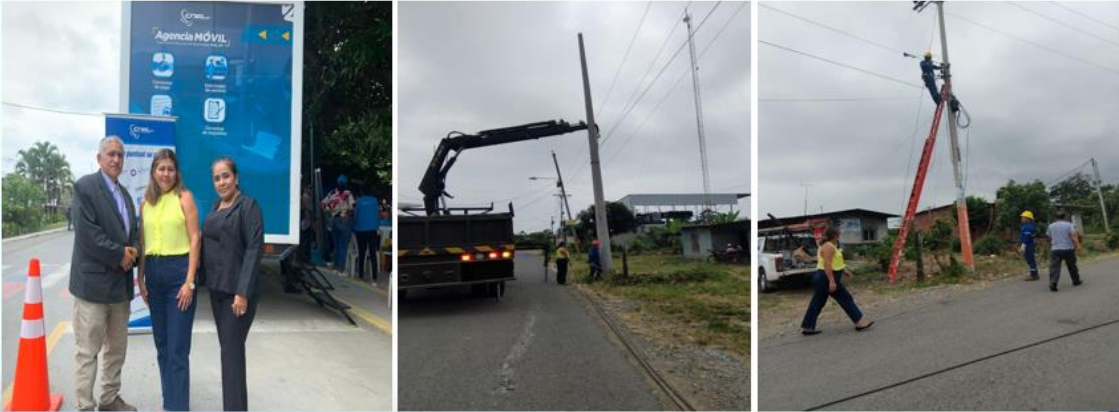
Rendición de cuentas institucional - 2023

Gestión de unidad móvil y atención de necesidades y problemáticas de servicio con CNEL EP