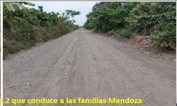
Trabajos en la vía Santa Rosa No.2 que conduce a las familias Mendoza

Rendición de cuentas institucional - 2023