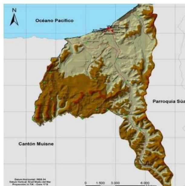
Mapa 1. Ubicación de la parroquia Tonchigüe.