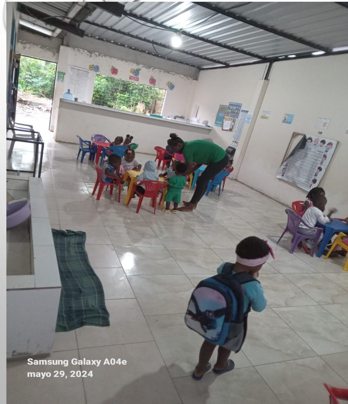
Samsung Galaxy A04e mayo 29, 2024