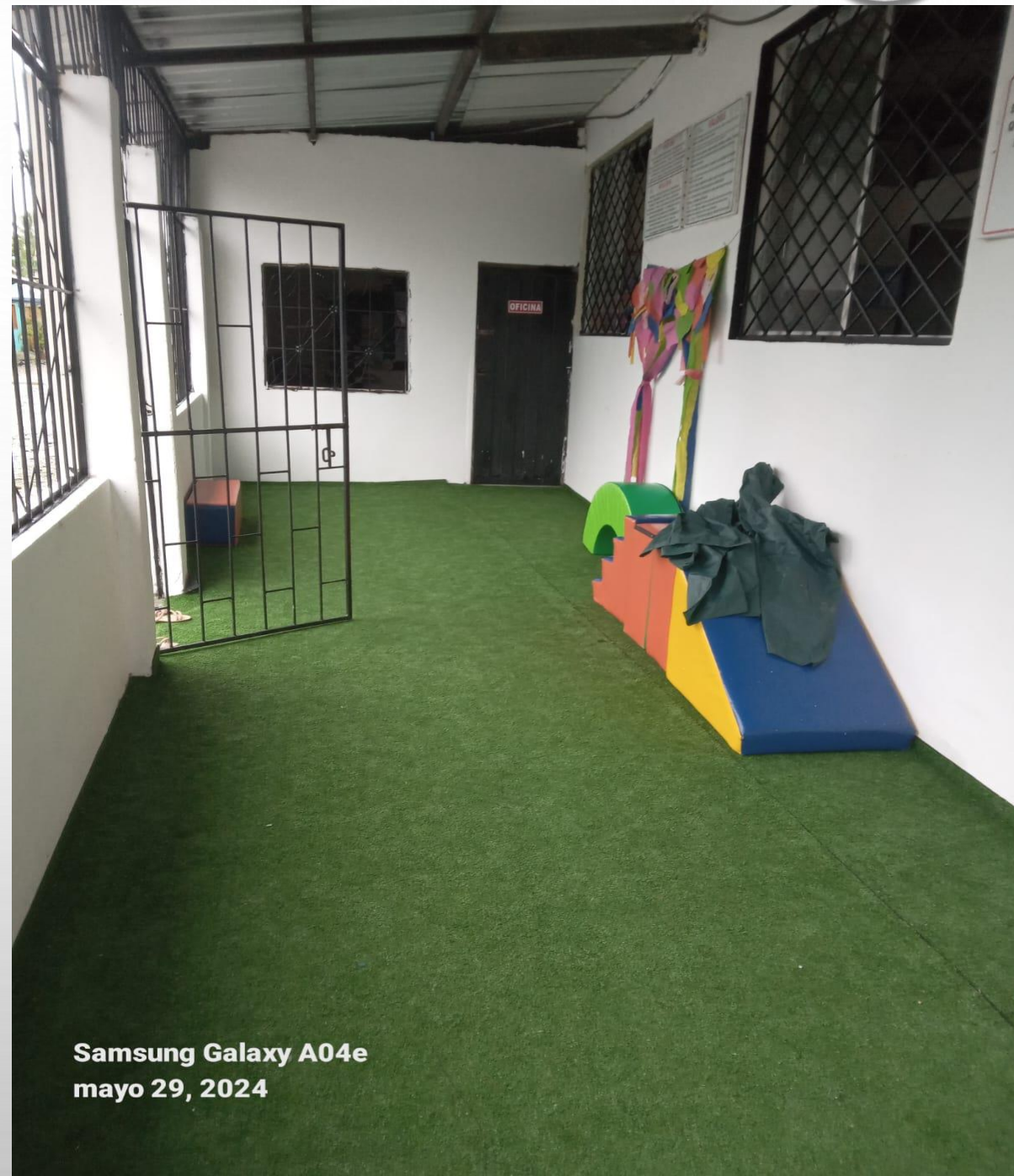
Samsung Galaxy A04e mayo 29, 2024