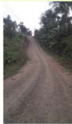
OBRA: REHABILITACIÓN DE LAS VÍAS "LOS PINCAY" Y "AIRE LIBRE" EN LA COMUNIDAD LAS LOZAS