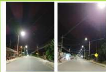
PROYECTO: "COLOCACION DE 28 POSTES CON LAMPARAS TIPO LED DESDE EL SECTOR LA GARITA HASTA LA SUBIDA A LA LOMA DE LA COMUNIDAD BALZAR"