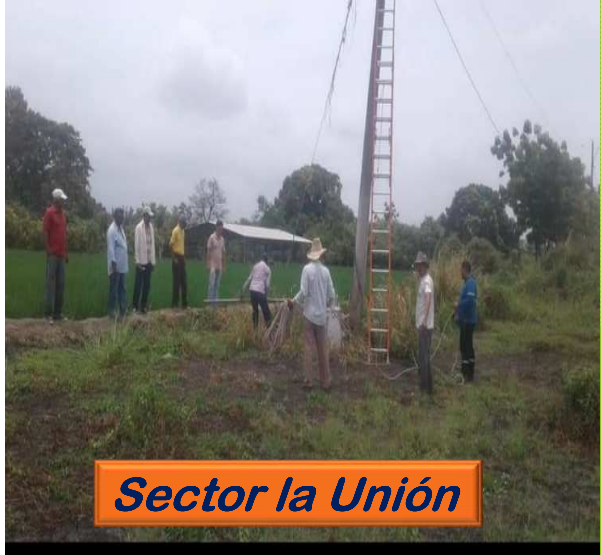
Sector la Unión