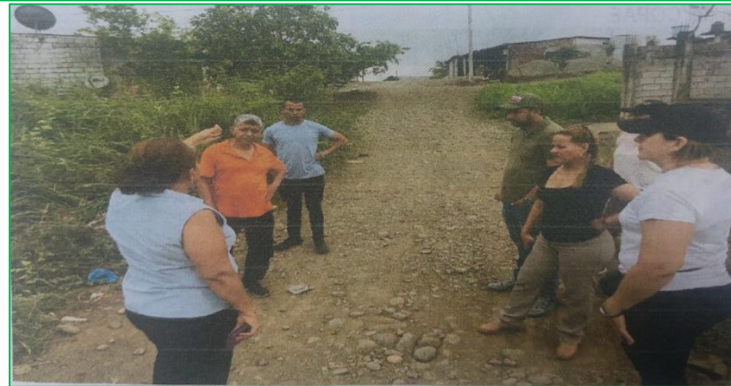
Visita en el Rcto Chipe Minuape