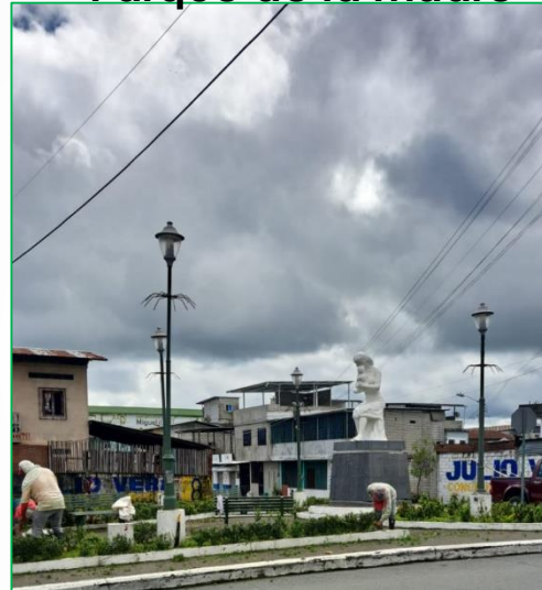
Parque de la Madre