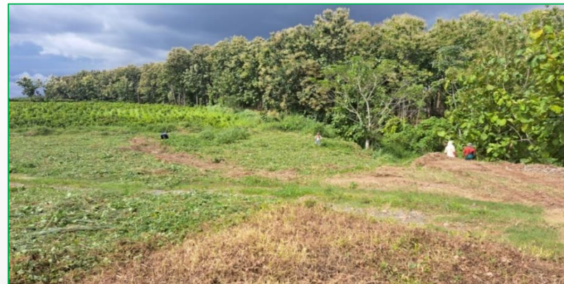
Parte Exterior del cementerio General