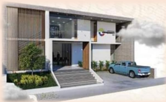
ESTUDIO ELECTRICO MIRADOR