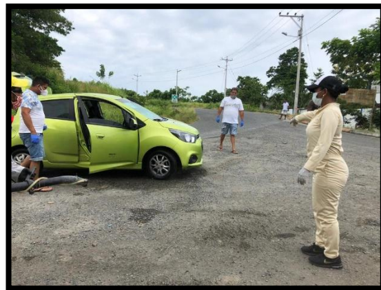
Desinfección para evitar COVID-19