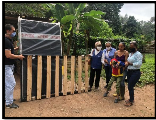
Entrega de cama y colchón