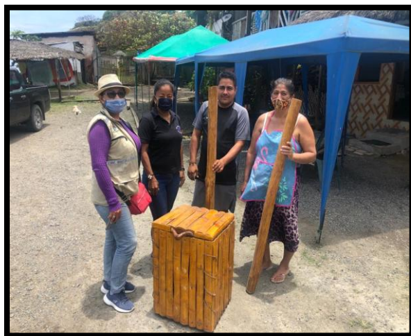
Entrega de recolectores de basura