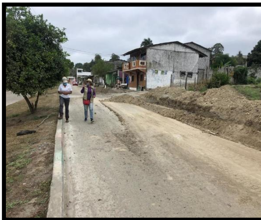
Adoquinado, aceras y bordillos