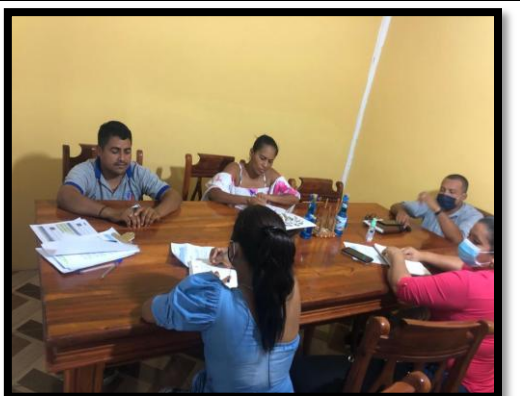
Participar en sesión ordinaria