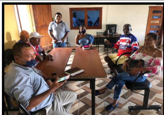
Participar en sesión ordinaria