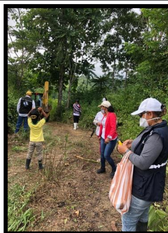
Revisión del sistema de agua