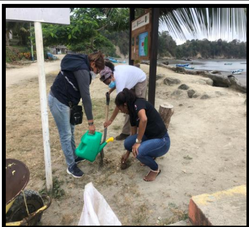
Plantación de árboles