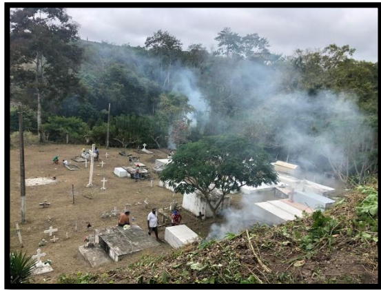
Minga en Cementerio