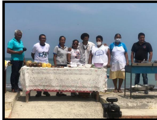
Promoción de turismo de la parroquia