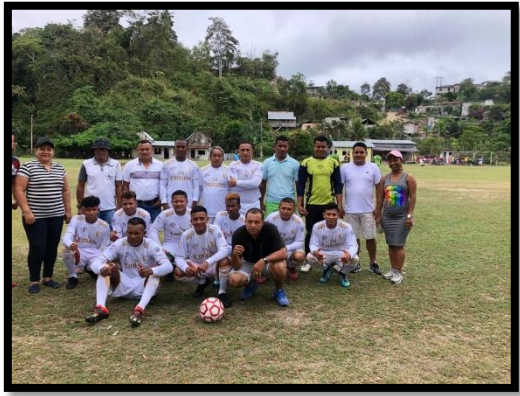
Deportes en parroquialización