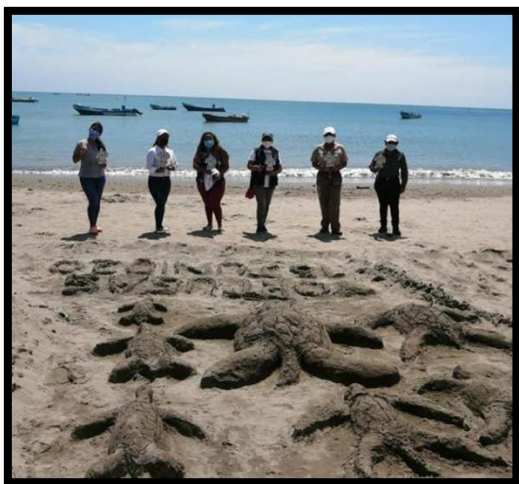
Día Mundial de la tortuga