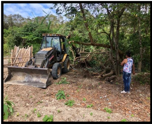
Relleno de la orilla del río