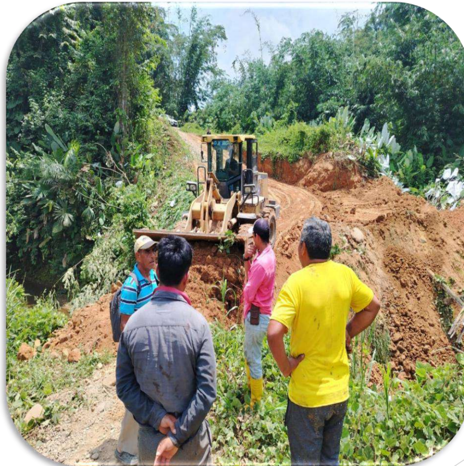
VIA PLAYTIA PALESTINA