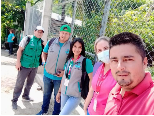
Brigada medica en la comunidad Zapote