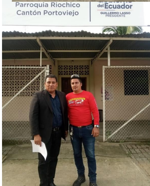
Intervención en la comunidad la Encantada por fuertes lluvias.