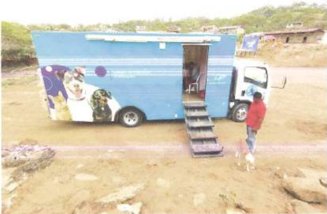
9-11-2023 brigada medica por parte de la alcaldía ciudadana de guayaquil y vacunación contra el COVID Y Influenza por parte del ministerio de Salud Publica en el recinto mamey.