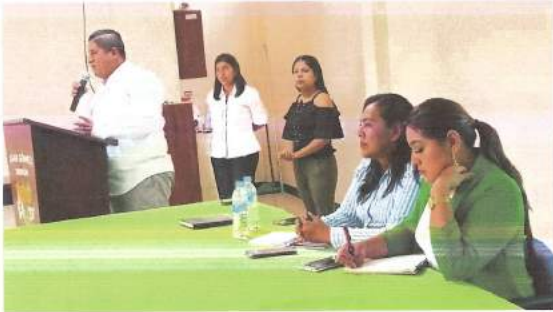
24-11-2023 visita de la Prefectura ciudadana del Guayas, donde se realizo la inspección para la colocación de Punto Wifi dentro de la cabecera parroquial.