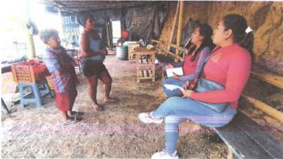
18-11-2023 fumigación de vectores en la cabecera parroquial, sabana grande, el Puerto de Sabana grande y San Lorenzo