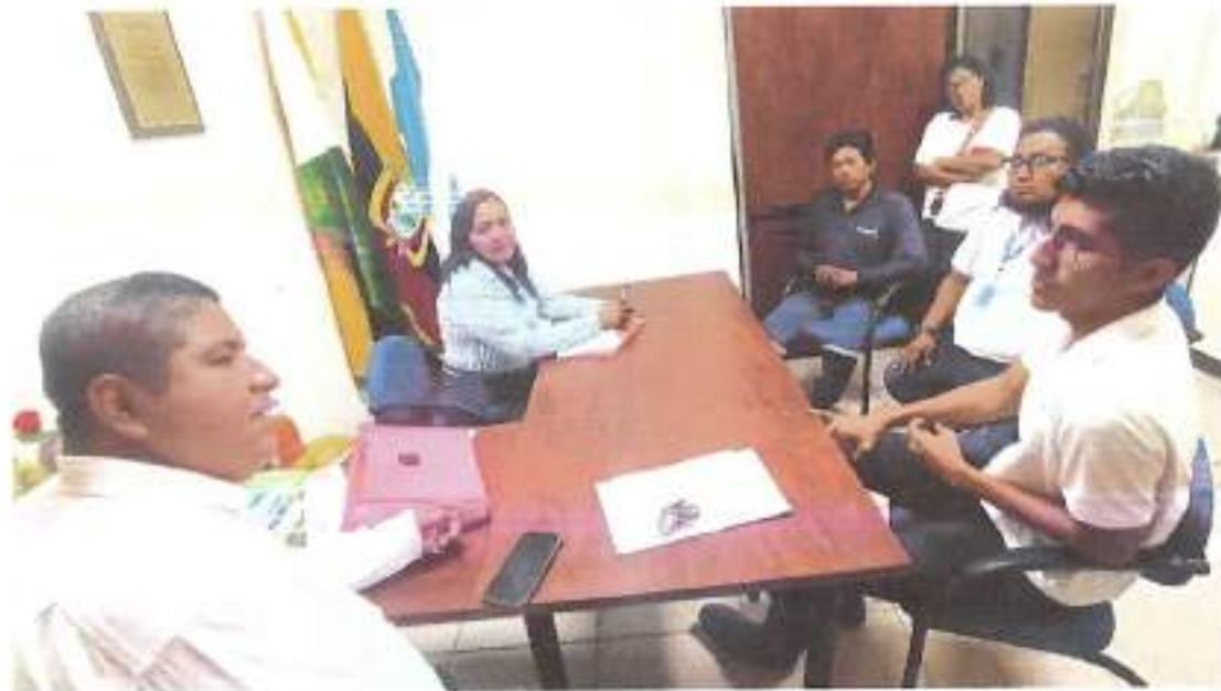
25-11-2023 brigada de cedulaación y Matrimonio Civil donde contrajeron matrimonio 9 parejas realizado por el registro civil Municipal. Y se brindó cedulaación y renovación a la ciudadanía.