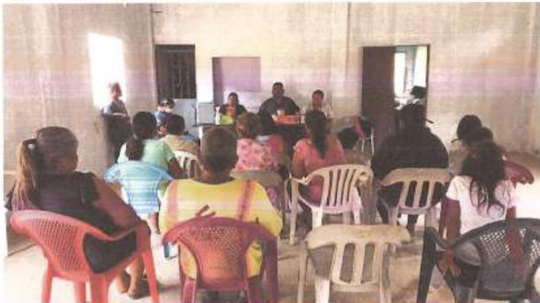
10-11-2023: Visita de autoridad aeroportuaria solicitando direccionamiento a los barrios del Misael Pezo 1 y 2 para realizar el Censo del alcantarillado.