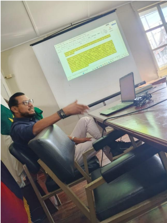
Ilustración 4 ACOMPAÑAMIENTO EN ACTUALIZACIÓN DE PDOT