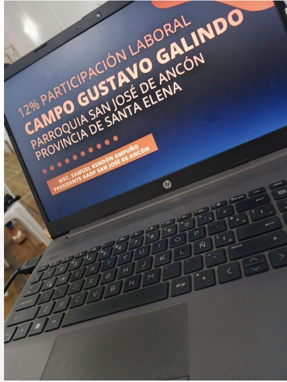
Ilustración 2 ASISTENCIA EN CONVOCATORIAS CIUDADANAS