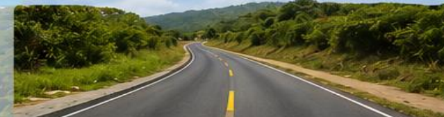
VÍAS QUE NOS UNEN