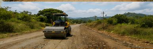
CONECTIVIDAD QUE IMPULSA EL DESARROLLO