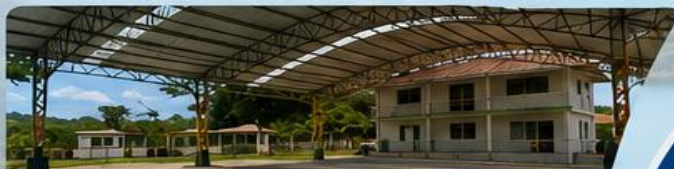
OBRAS QUE TRANSFORMAN

Construimos hoy un mejor mañana para Colonche y su gente