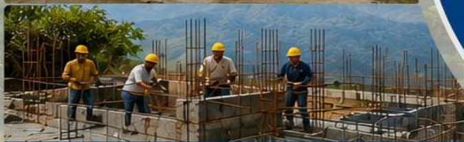
ESPACIOS DIGNOS PARA TODOS